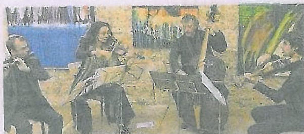
L'ensemble Philidor (direction musicale, Mira Glodeanu) a donné un concert magique dans la salle de la Porterie.

Samedi, c'était les extraordinaires interprétations de pièces de Mozart, Haydn, Jo-