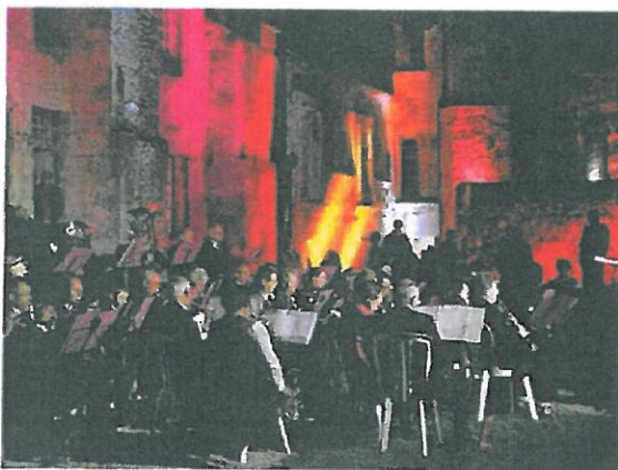
Le concert s'est tenu devant l'abbaye illuminée.