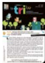
La Lettre de la TRI ® n° 15.