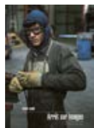
Arrêt sur Images sur l'entreprise Piot CMP réalisé par le photographe Stephan Larroque.

Magazine de Loches Développement, avenue de la Liberté, BP 142, 37601 Loches cedex. Tél. 02 47 91 19 20 www.lochesdeveloppement.com Directeur de la publication : Pierre Louault. Rédaction : Elise Pierre. Création : Céline Morissonnaud. Impression : Imprimerie RL. Photos : Stephan Larroque. ISSN 1960-9337. Dépôt légal à parution.