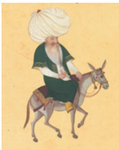
Les attributs de Nasr Eddin : son âne et son turban.