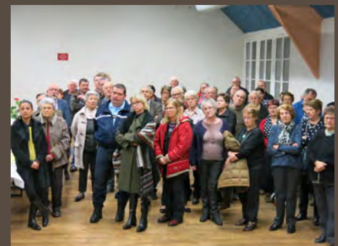
Cérémonie des vœux