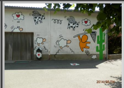
réalisée par l'association Farandole