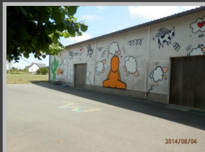
Fresque cour École Jacques Prévert

Résumé : A la suite de circonstances indépendantes de sa volonté, une jeune étudiante voit ses capacités intellectuelles se développer à l'infini. Elle « colonise » son cerveau, et acquiert des pouvoirs illimités.