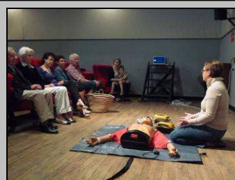
Le 29/5, formation défibrillateur