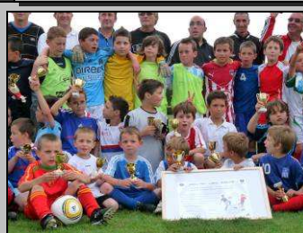
Le 9, remise du label FFF