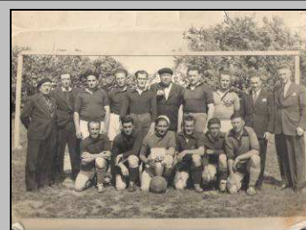
Le 19, soirée Cormery jadis