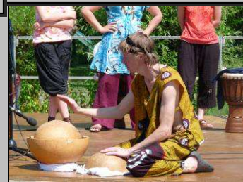
Le 27, kermesse de l'école