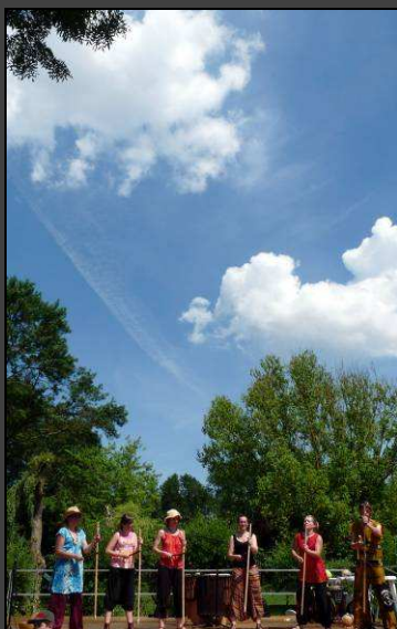
Comme un air d'Afrique occidentale ... !