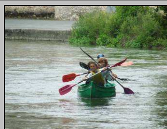
Le 16, raid inter-collèges