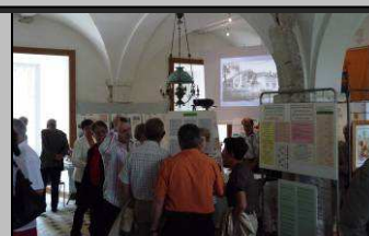
Le 13, expositions au logis Boyer