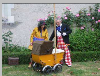
Le 29/5, kermesse de l'Abbatiale