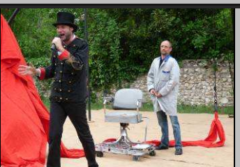
Le 30/5, Wahrschein Kabarett