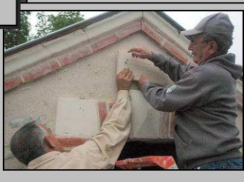
Le 19, inauguration de la logette