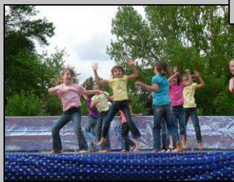
Le 13, gala de danse