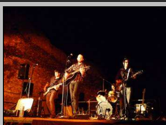
Le 21, fête de la musique