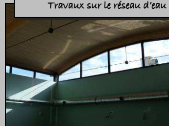
La nouvelle cantine avance