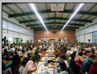
Le 29/5, loto géant au gymnase

http://picasaweb.google.fr/photosCormery/