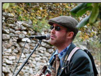
Le 21, fête de la musique