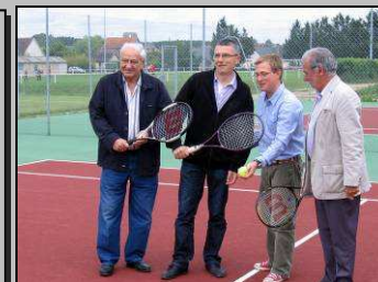
Le 19, inauguration des tennis