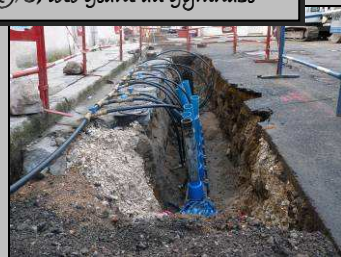
Travaux sur le réseau d'eau